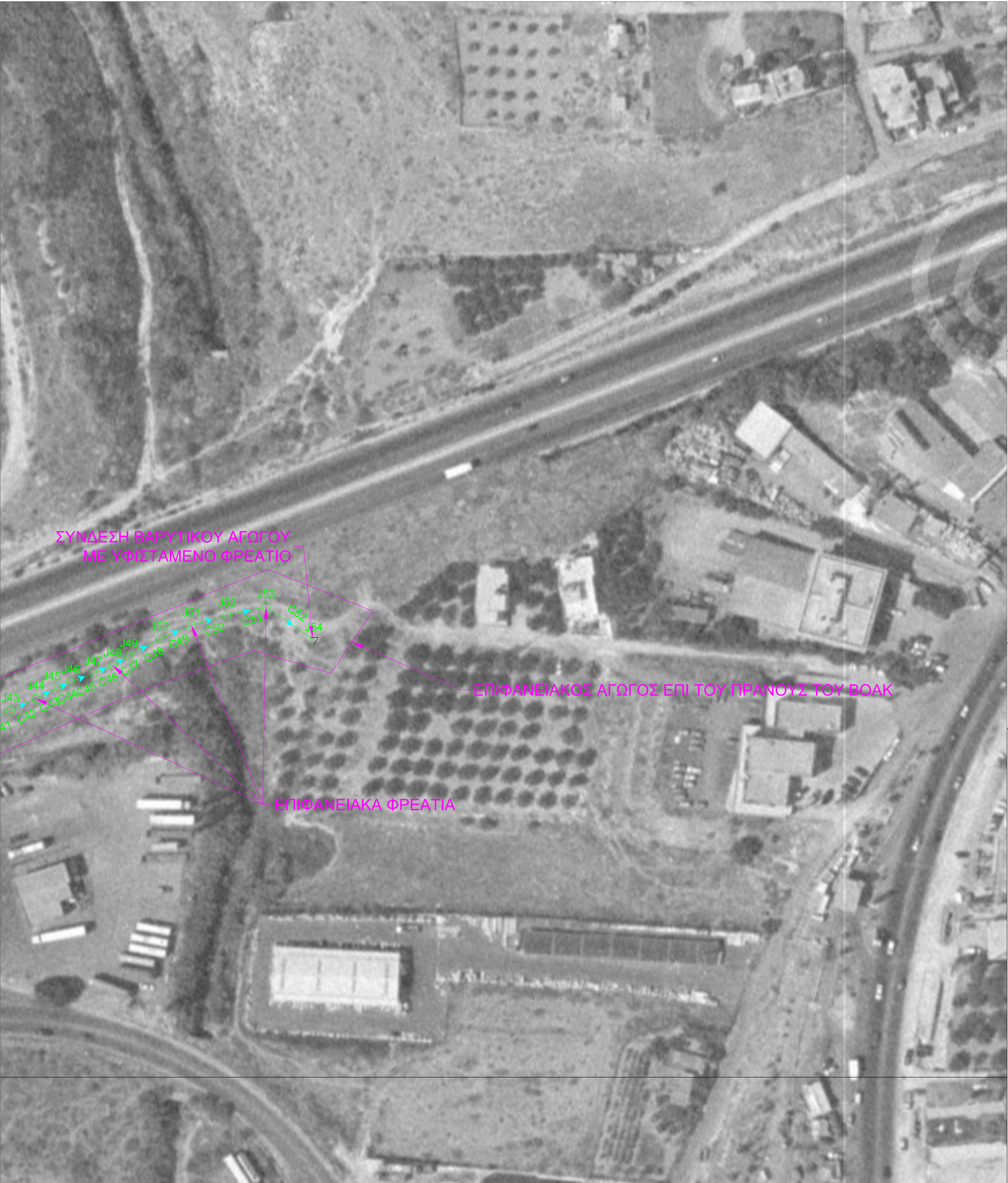
ΔΙΑΓΡΑΜΜΑ ΣΥΝΔΕΣΕΩΣ ΦΥΛΛΩΝ